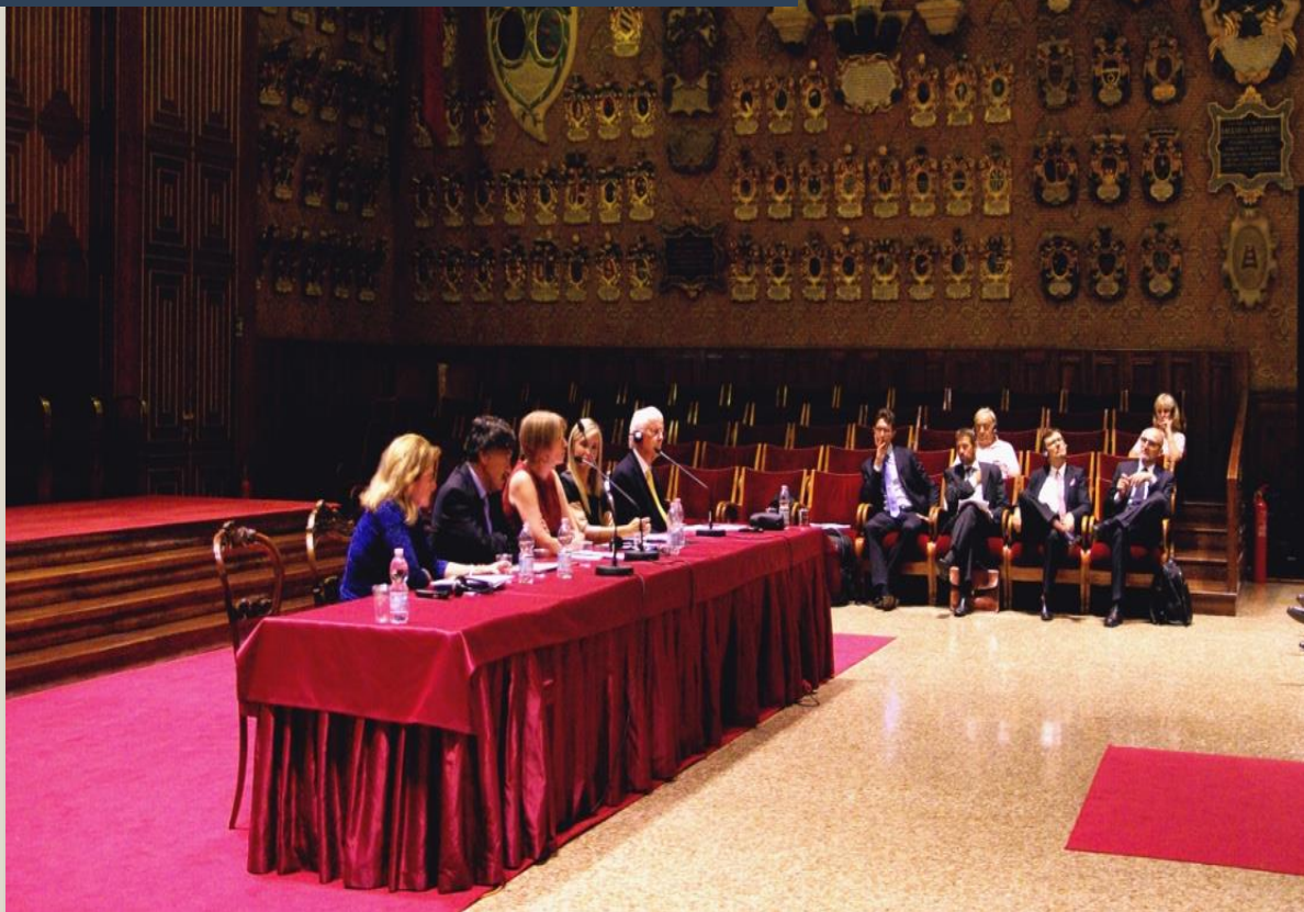
University of Padua, School of Law Italy, Sept. 2016